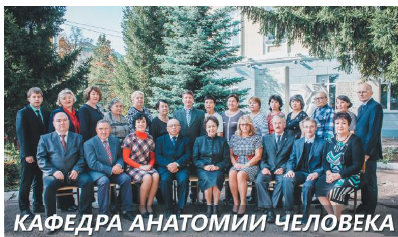
КАФЕДРА АНАТОМИИ ЧЕЛОВЕКА