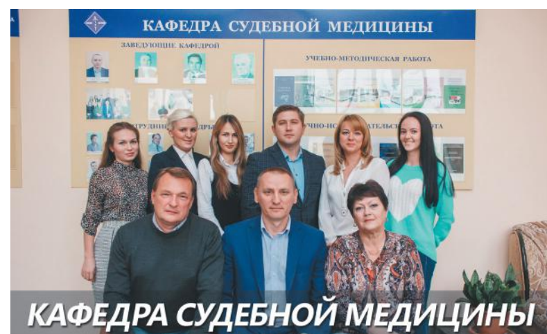
КАФЕДРА СУДЕБНОЙ МЕДИЦИНЫ