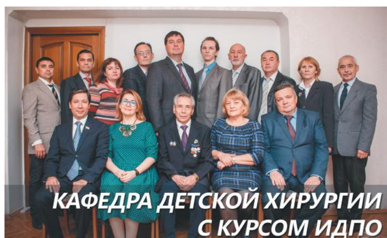
КАФЕДРА ДЕТСКОЙ ХИРУРГИИ С КУРСОМ ИДПО