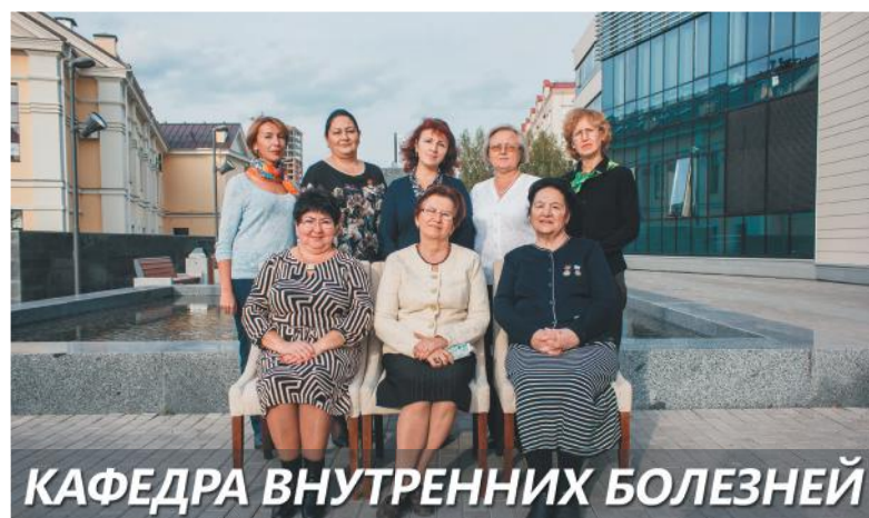
КАФЕДРА ВНУТРЕННИХ БОЛЕЗНЕЙ