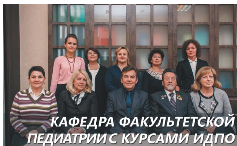
КАФЕДРА ФАКУЛЬТЕТСКОЙ ПЕДИАТРИИ С КУРСАМИ ИДПО