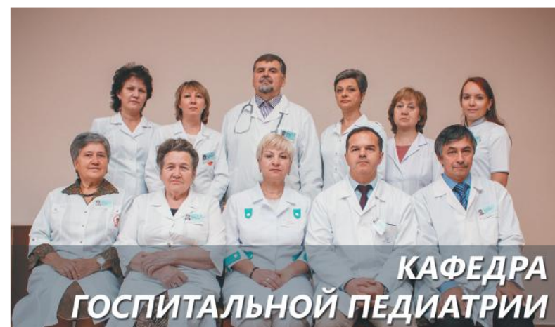
КАФЕДРА ГОСПИТАЛЬНОЙ ПЕДИАТРИИ