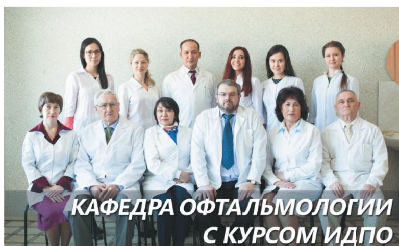
КАФЕДРА ОФТАЛЬМОЛОГИИ С КУРСОМ ИДПО