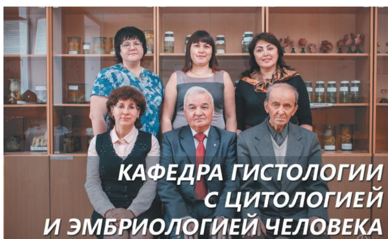
КАФЕДРА ГИСТОЛОГИИ С ЦИТОЛОГИЕЙ И ЭМБРИОЛОГИЕЙ ЧЕЛОВЕКА