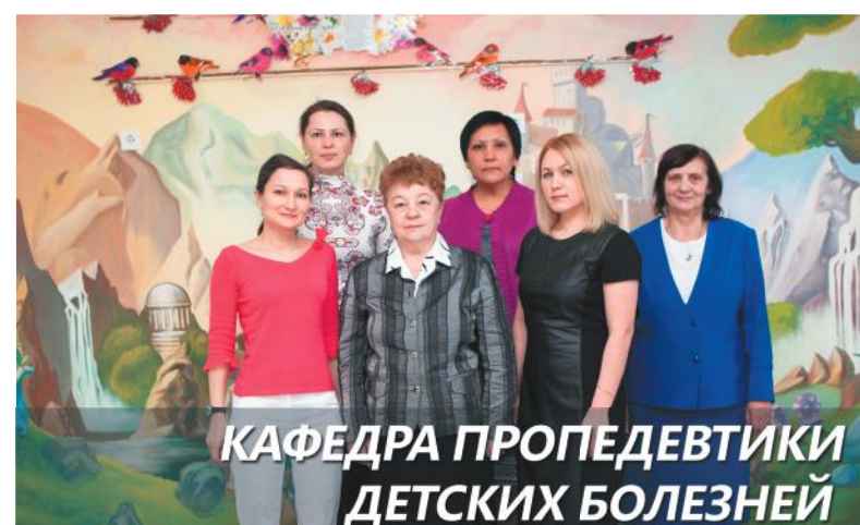
КАФЕДРА ПРОПЕДЕВТИКИ ДЕТСКИХ БОЛЕЗНЕЙ