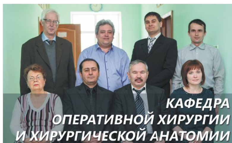
КАФЕДРА ОПЕРАТИВНОЙ ХИРУРГИИ И ХИРУРГИЧЕСКОЙ АНАТОМИИ