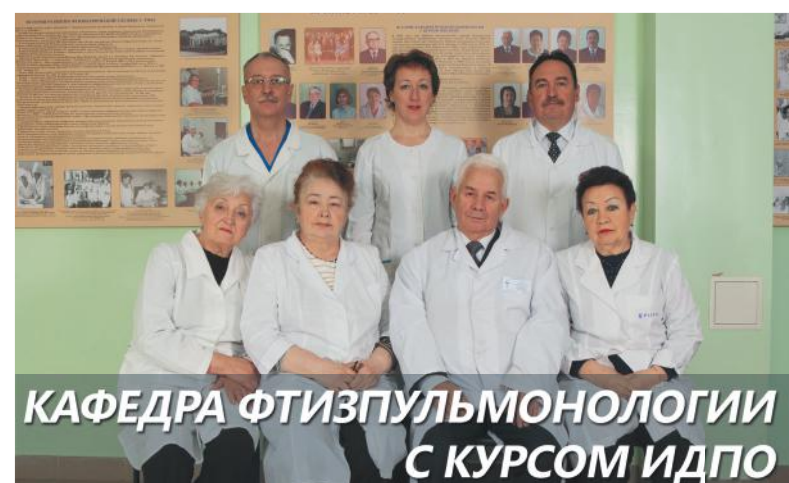
КАФЕДРА ФТИЗПУЛЬМОНОЛОГИИ С КУРСОМ ИДПО