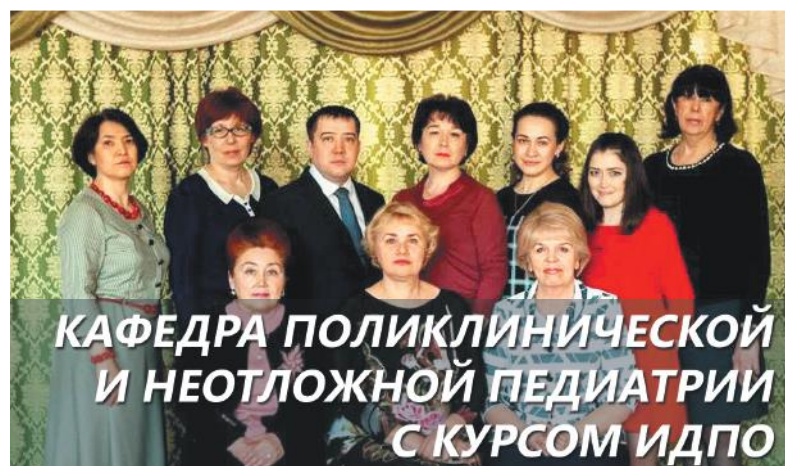
КАФЕДРА ПОЛИКЛИНИЧЕСКОЙ И НЕОТЛОЖНОЙ ПЕДИАТРИИ С КУРСОМ ИДПО