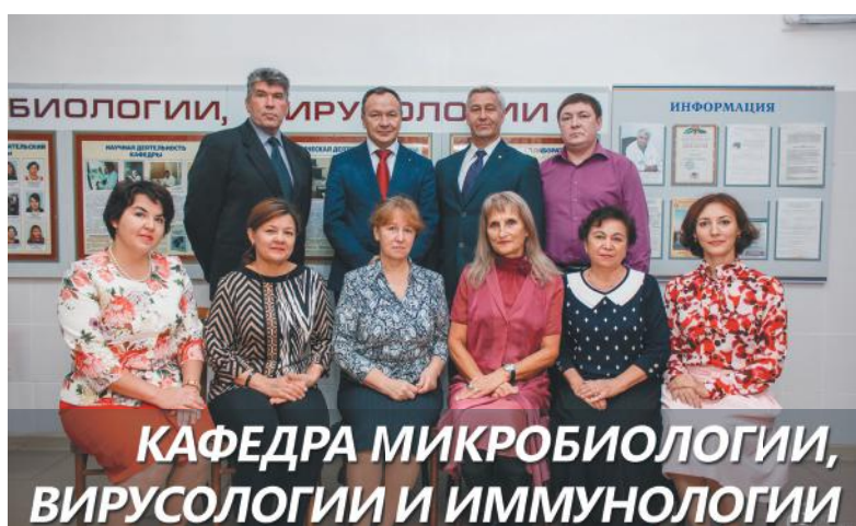
КАФЕДРА МИКРОБИОЛОГИИ, ВИРУСОЛОГИИ И ИММУНОЛОГИИ