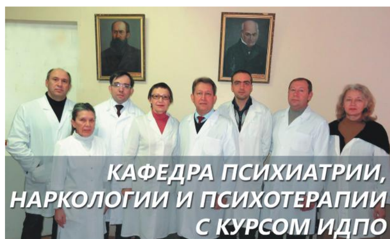
КАФЕДРА ПСИХИАТРИИ, НАРКОЛОГИИ И ПСИХОТЕРАПИИ С КУРСОМ ИДПО